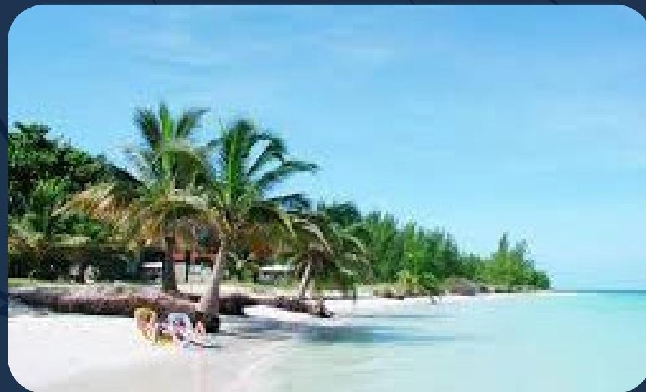
Las Conchas Uno y Dos en Varadero