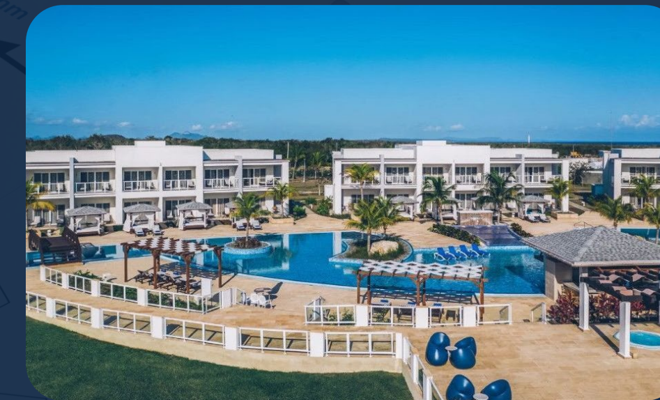
Hotel Almirante Guardalavaca