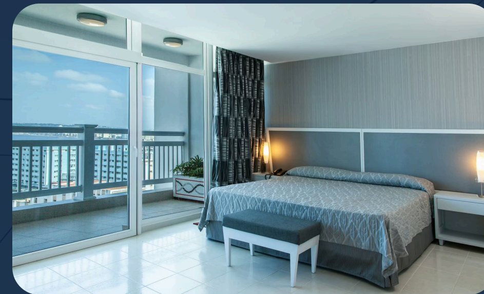
NH Capri La Habana