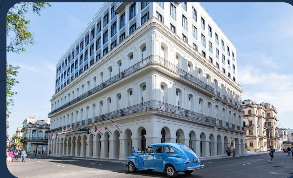
Gran Hotel Bristol La Habana