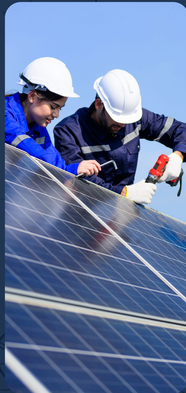
Producción de energía