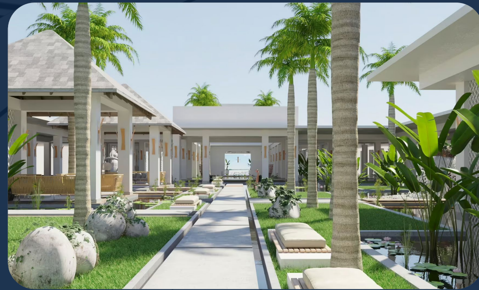
Hotel Melia Trinidad