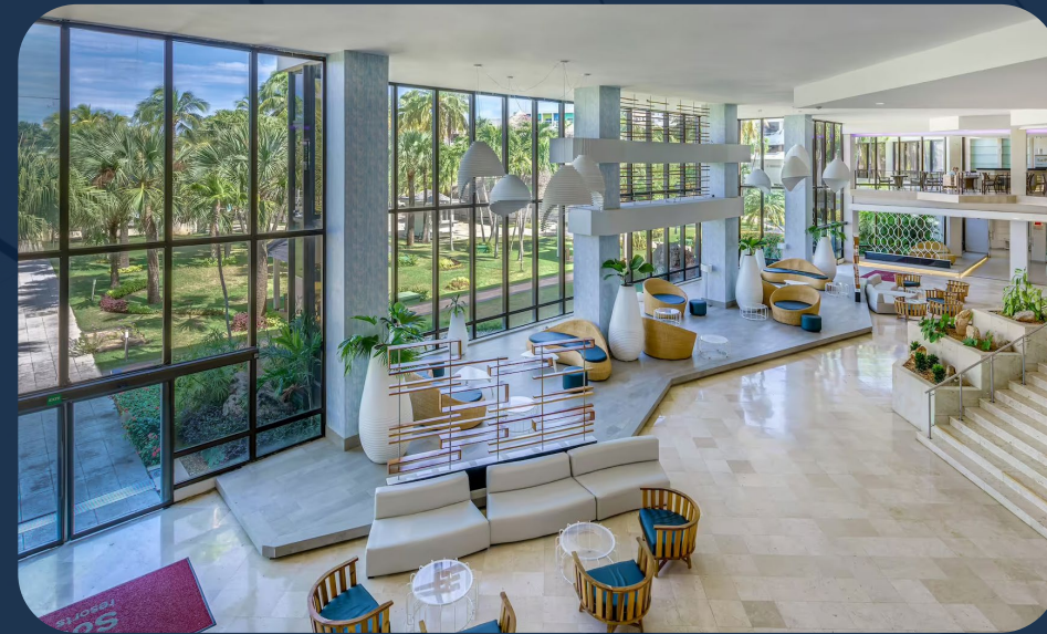
Hotel Melia Sol-Palmeras