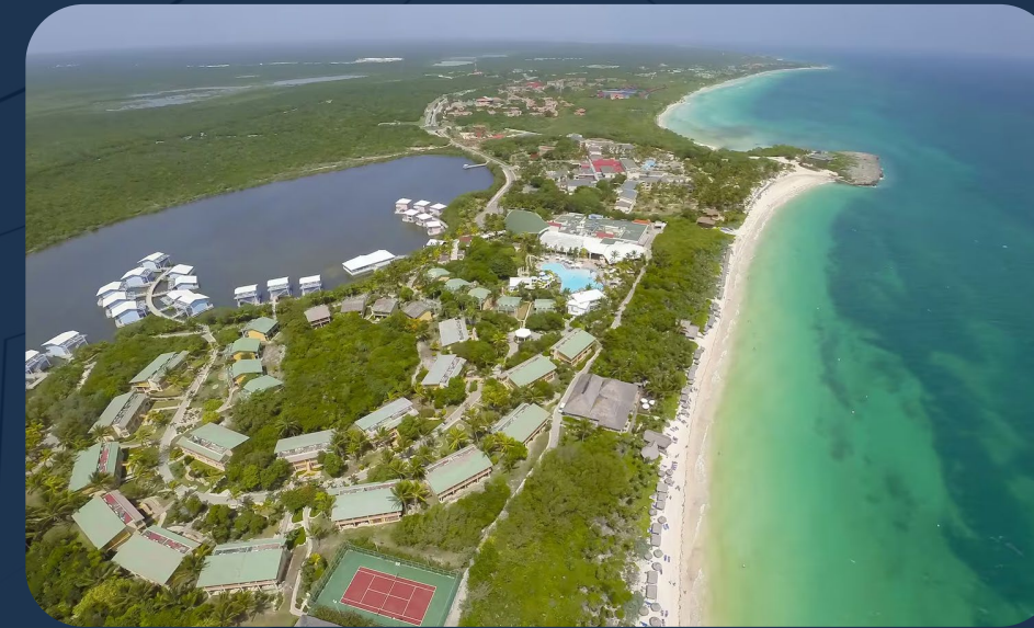
Hotel Melia Cayo Coco