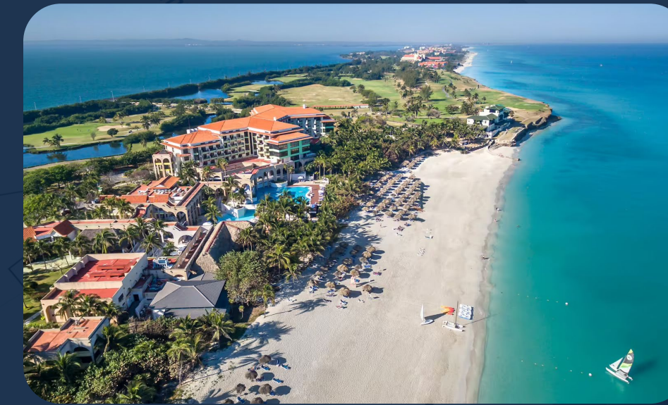
Hotel Melia Americas