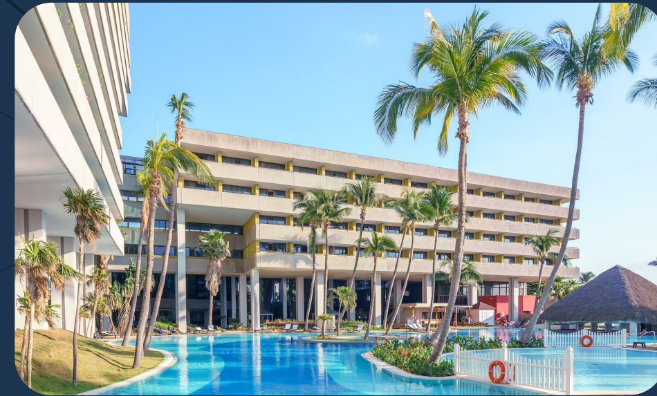
Hotel Melia Habana