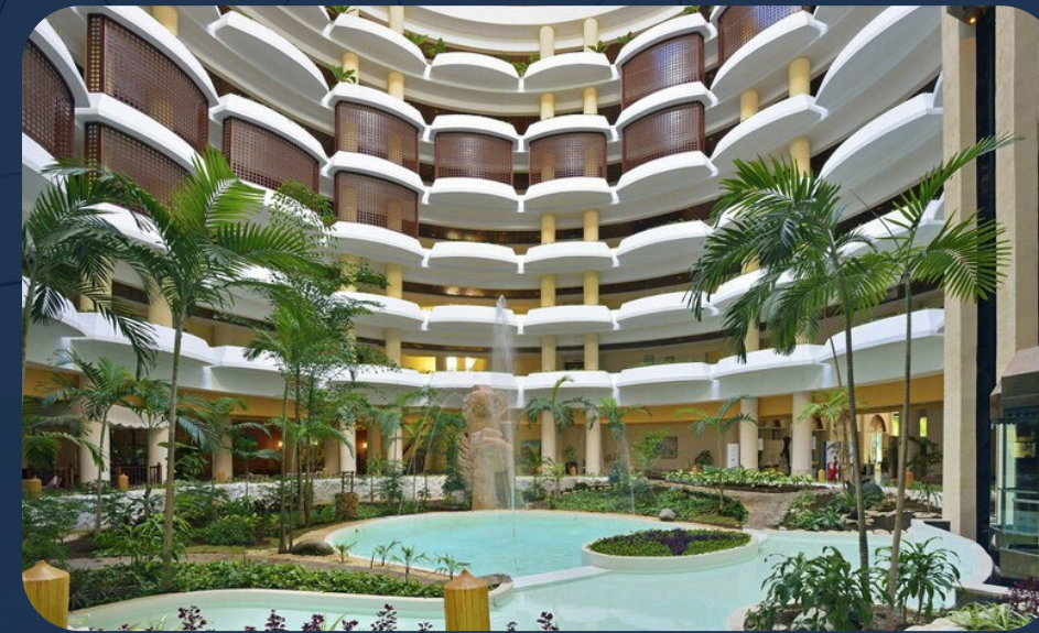
Hotel Melia Varadero