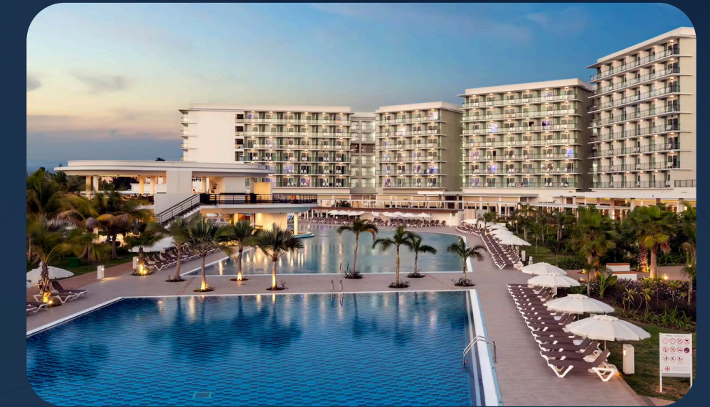
Hotel Melia Internacional Varadero